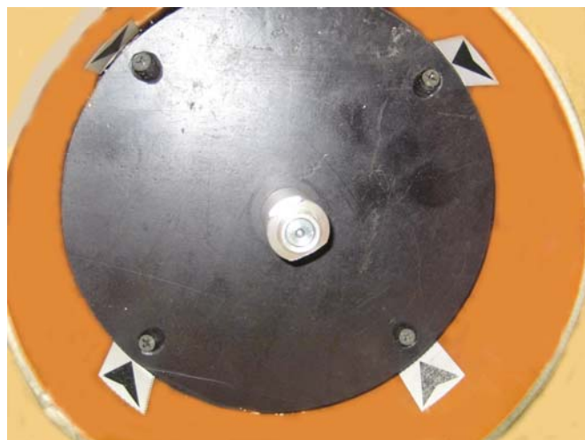
Верхний транспортный фланец

2. Извлекать ИПК из транспортного контейнера необходимо только за транспортные фланцы, выталкивая ИПК в направлении от нижнего фланца (с тремя шпильками, указан заводской номер) к верхнему (крепление молниеотвода).